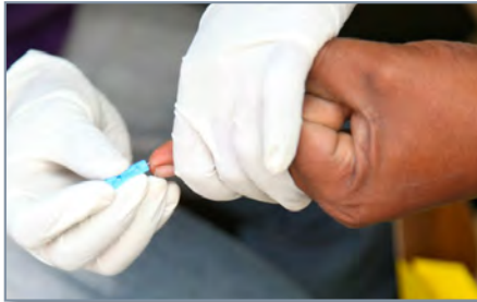
Prueba en sangre capilar

Los niños que no se hayan realizado un análisis de sangre antes de los 24 meses de edad deberán someterse a una prueba tan pronto como sea posible, antes de los seis años de edad o antes de entrar al jardín de niños, lo que ocurra primero.