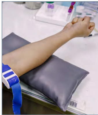
Prueba en sangre venosa

El médico le recetará una prueba en sangre capilar (obtención de sangre mediante un “pinchazo en el dedo”) o una prueba en sangre venosa (obtención de sangre del brazo).